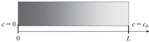
Рис. 1. Замедление скорости распространения волны на конечном интервале [L-0] до нулевого значения.